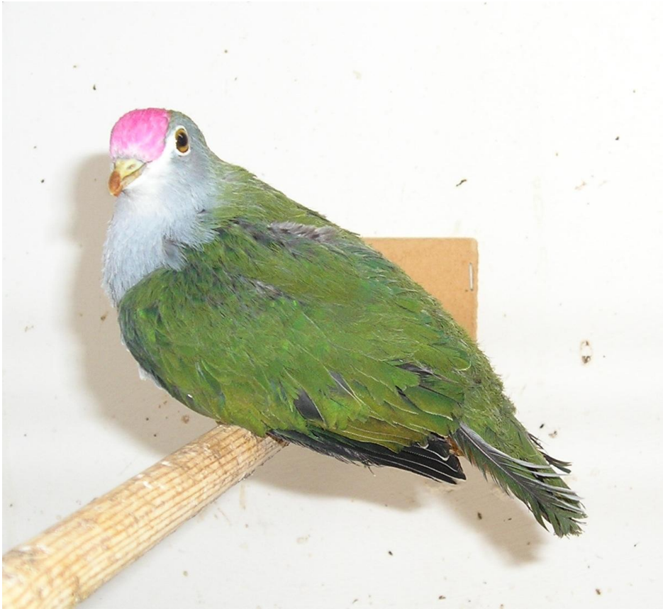
Foto: Karmijnkap Vruchtenduif Latijnse naam: Ptilinopus Pulchellos

Door het weglooptgedrag van de ouderdieren kan hij niet te vroeg in het seizoen beginnen te fokken, omdat als het jong er eenmaal is deze het ook niet volhoudt als hij alleen gelaten wordt.