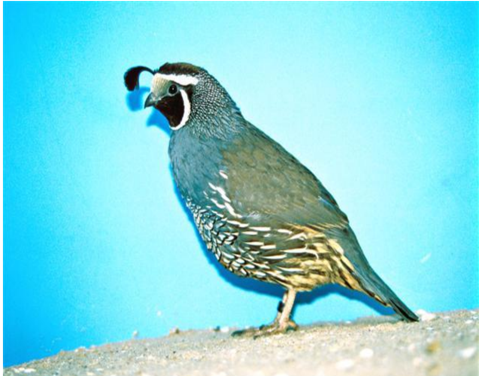
Foto: Californische kuifkwartel wildkleur ( Callipepla california ) haan © N.H. van Wijk

Er mag nog steeds gejaagd worden op de Californische kuifkwartel. Dit is de sportjacht die in Amerika overal veel wordt uitgeoefend. Maatregelen om deze jacht in te dammen mislukte keer op keer. De Amerikaanse jachtlobby is ijzersterk en gekoppeld aan het feit dat iedereen vuurwapens mag hebben en gebruiken. Het ziet er ook niet naar uit dat de sportjacht op deze mooie vogels kan worden beteugeld, daarvoor is de jachtlobby te sterk. Maar gelukkig is er toch wel langzaam een kentering te zien.