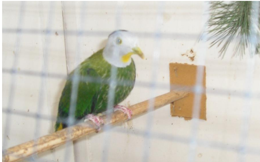
Foto: Zwartnekvruchten duif. Latijnse naam: Ptilinopus melanospila

Van alle jongen die geboren worden wordt verslag gedaan aan de speciaalclub voor vruchtende duiven. Alle in Nederland en België aanwezige vruchtende duiven worden geregistreerd bij de werkgroep Wilde duiven van Aviornis. Zo waren er in 2006 van de vruchtende duiven die behoren tot de familie Ptilinopus 26 koppels en daarvan werden slechts 14 jongen geboren.