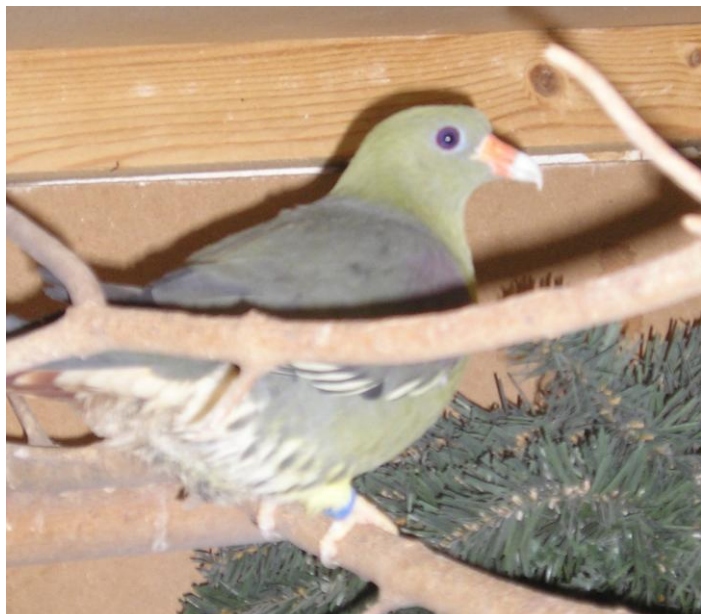
Foto: Afrikaanse Groenduif (Papagaaiduif) Latijnse naam: Treron Calva

De papagaaiduif waarvan hij ook een koppel heeft staat op de negatieve lijst. Dat betekent dat er dit jaar nakomelingen moeten komen anders wordt de vermelding op de negatieve lijst definitief en mag er helemaal niet meer mee gekweekt worden. Het zou heel jammer zijn als het dit jaar niet lukt want dit betekent eigenlijk dat zodra de dieren die nu nog in gevangenschap gehouden worden dood gaan, er een ras verdwijnt uit Nederland.