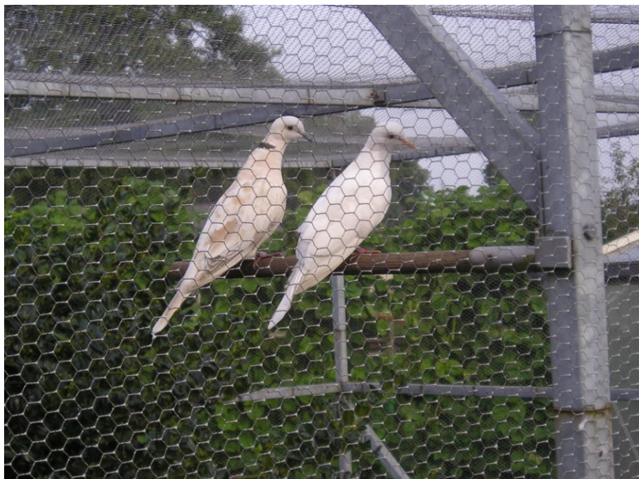
Foto: De achterste duif is de pastel die nu bont pastel is.

Ik wist al wel dat zonlicht de kleur van een Lachduif enorm kan verbleken, maar dit was toch wel erg bizar.