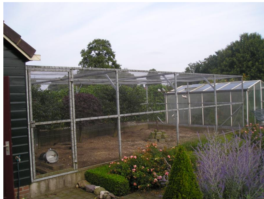
Foto: De prachtige grote voliere, die helaas ongeschikt is voor tentoonstellingsdieren.

Ik zou graag van andere fokkers vernemen of zij ook ervaringen hebben met dit soort verschijnselen.