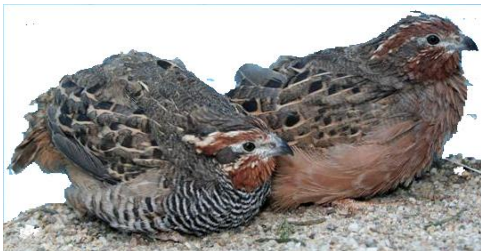
Koppel frankolijn kwartels, links haan ,rechts hen