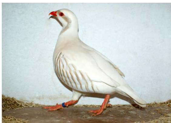
Nr. 1 kooi nr. 4078 Chuckar Patrijs eigenaar G.v.Werven predicaat F 96