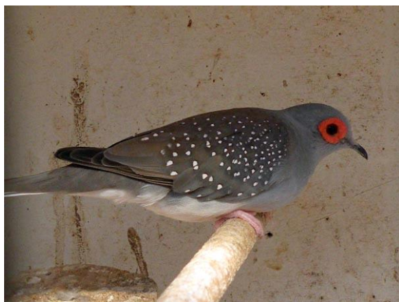
Nr. 1 kooi nr. 4148 Wildkleur eigenaar R.C.H.v.d. Kerkhof predcaat F 96