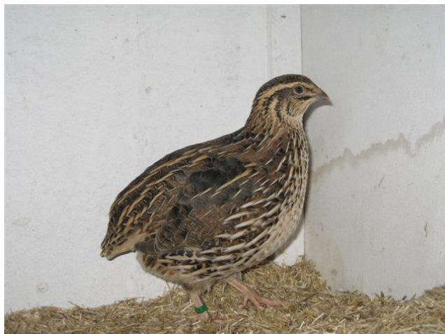
Nr.1 kooi nr. 3988 Japanse Kwartel eigenaar Jaap Stelling predicaat U 97