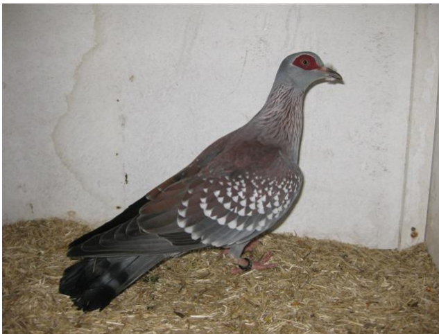
Nr.1 kooi nr. 4158 Guinea duif eigenaar Aart-Jan Vierhout predicaat U 97