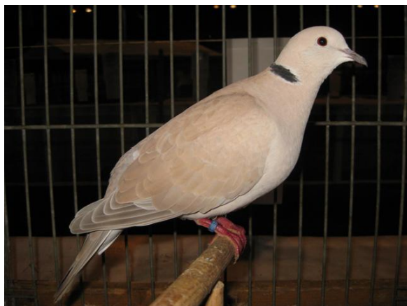
Nr. 1 kooi nr. 4100a Pastel eigenaar Leon van Werven predcaat U 97