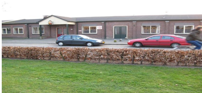
De vergaderlocatie in Apeldoorn.

****Voor het komende tentoonstellingsseizoen zijn er al een flink aantal aanvragen binnengekomen. Verenigingen/ organisaties die niet tijdig een officieel verzoek tot het organiseren van een districtsshow indienen, komen niet in aanmerking voor een toewijzing. Dit verzoek moet voor 20 februari binnen zijn bij de secretaris. Dus een mondeling verzoek op de ledenvergadering kan niet meer in behandeling worden genomen!!