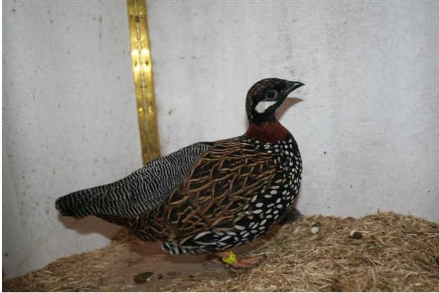
Nr.1 kooi nr. 4069 Halsband Frankolijn eigenaar Maarten Vierhout predicaat F 96