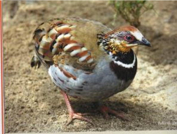
Ricket (Chinese) Bospatrijs