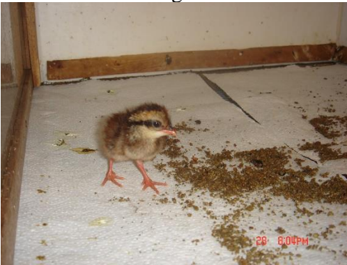
bruinborstpatrij's enkele dagen oud.

De gaasbodem van de kunstmoeder dek ik af met keukenpapier. Dit is ruw en is snel te vervangen en de kleur is wit.