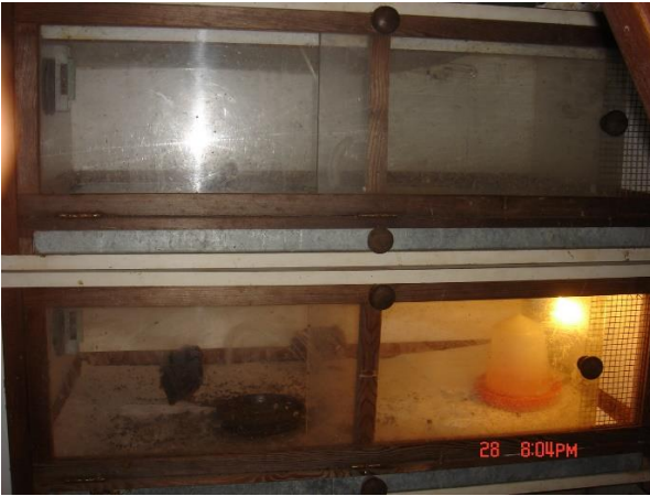
2 kunstmoeders gestapeld.

Voor kuikens die net uit de broedmachine komen houd ik de temperatuur op ongeveer 33 °C. De verandering van temperatuur moet voor de kuikens klein zijn.