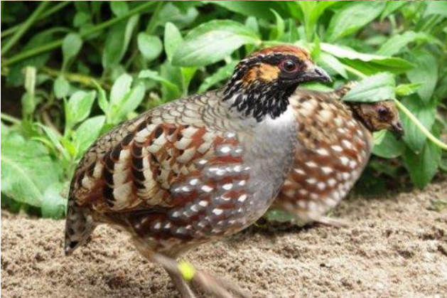
Heuvelpatrijs (Tibetaanse Bospatrijs)