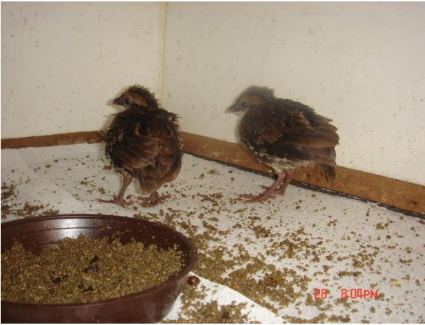
bruinborstkuikens 18 dagen.

Ik ben altijd traag met het verlagen van de temperatuur. Na 3 weken is die meestal weinig onder de 30 °C gezakt. De kuikens beginnen er dan in de kunstmoeder echt een puinhoop van te maken. Dan probeer ik de kuikens naar een andere ruimte over te plaatsen. Ik zet ze over naar een ruimte van 120 x 120 (oude opfokruimtes voor kippenkuikens). De ruimte wordt verwarmd met een warmtelamp. Ik zorg dat het direct onder de lamp ongeveer 35 °C is. Omdat de ruimte alleen aan de voorkant open is wordt de hele ruimte redelijk verwarmd.