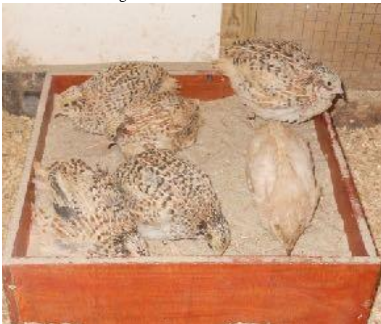
jonge Japanse kwartels nemen een zandbad

Soms met meerdere dieren tegelijk, prachtig om te zien hoe de dieren hiervan genieten. Het is echt genieten voor dier en fokker.