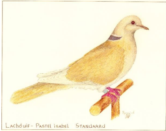
Lachduif - PASTEL isabel STANDAARD