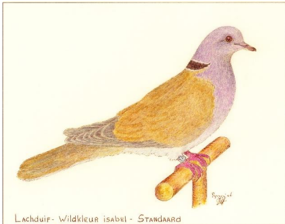
Lachduif - Wildkleur isabel - STANDAARD