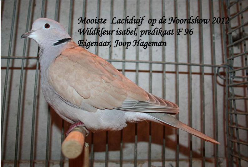
Mooiste Lachduif op de Noordshow 2012 Wildkleur isabel, predikaat F 96 Eigenaar, Joop Hageman