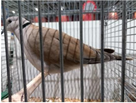
Wildkleur in optima-forma