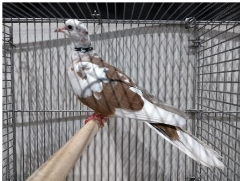
Prachtig gekleurde Wildkleur- spontaan-bont