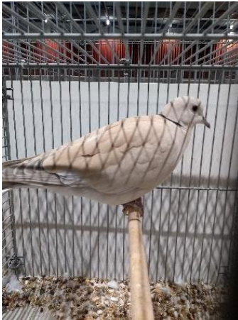
Pastelkleur welke verre van de norm afstaat