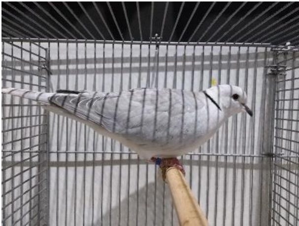
Grijze doffer van prachtige kwaliteit

Toevallig heb ik thuis ook nog wat kwartels, vooral daarom hadden deze ook mijn interesse . Ik zit nog te kort in deze materie om te kunnen zien wat een goede of een matige kwartel is . Vooral de Harlekijntjes trokken mijn aandacht , wat zijn dit toch prachtige kwarteltjes , al vond ik ze in Zwolle wat schuw . Nu wil het geval dat ik twee stelletjes heb welke gelijkwaardig mooi zijn ,toch legt het ene hennetje groen-gevlekte eitjes en het andere hennetje witte eitjes. Coromandel in gekruist werd beweerd , ik vind het prima , ze eten uit mijn hand. Japanse kwartels , ze kunnen mij niet groot genoeg zijn , dan zie ik ze beter , dan vertrap ik ze niet want de makheid is overdonderend . Wel eens kwartel eitjes gegeten , echt lekker. De Roul-Roul kwamen we ook tegen , hoe kun je nu de ene een hoog aantal punten geven en een volgende drukken ? Hoe heeft het mogen zijn dat de natuur zulke schoonheden aan het aardse bestel heeft kunnen toevoegen , dank u ..... Het was men waar genoeg.