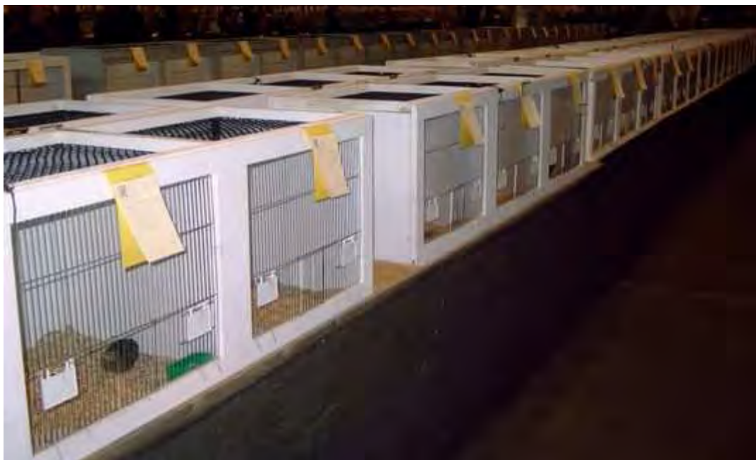
Fig. 21 Tentoonstellingskooien voor kleine siervogels

De inzender (of de vervoerder) plaatst de dieren in de kooien. De kooigegevens staan op de etiketten. De transportkist wordt onder de kooien plaatsen. De lege transportkisten blijven dus tijdens de kleindierententoonstelling onder kooien staan.