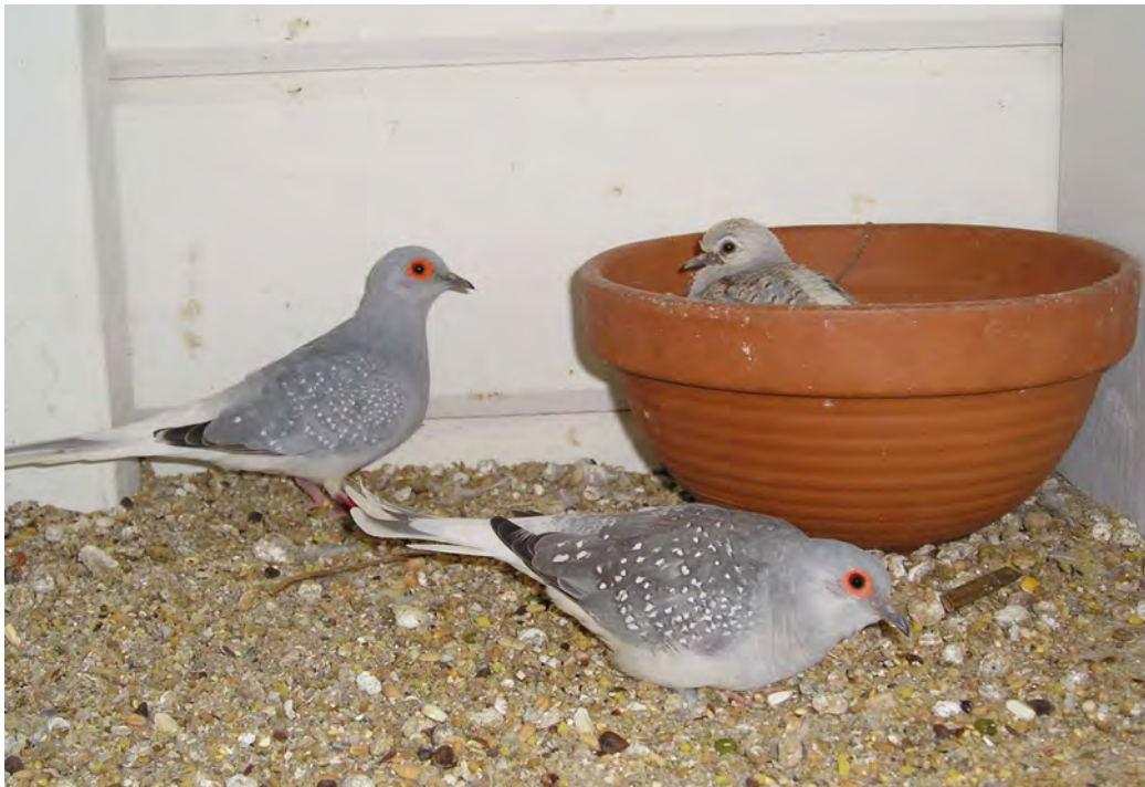
Fig. 14 Een koppel diamantduiven met hun jong in de broedschaal

Jonge diamantduiven groeien verbazingwekkend snel en op dag tien of elf vliegen de jonge duiven al. Drie weken later beginnen de jonge dieren al te verkleuren. Voor de rui zijn de jonge duifjes van de doffers te onderscheiden aan de meer bruine kleur van kop en hals. Na de rui zijn de geslachten moeilijker vast te stellen. Het spreiden van de staart is dan het beste herkenningsteken van de doffer.