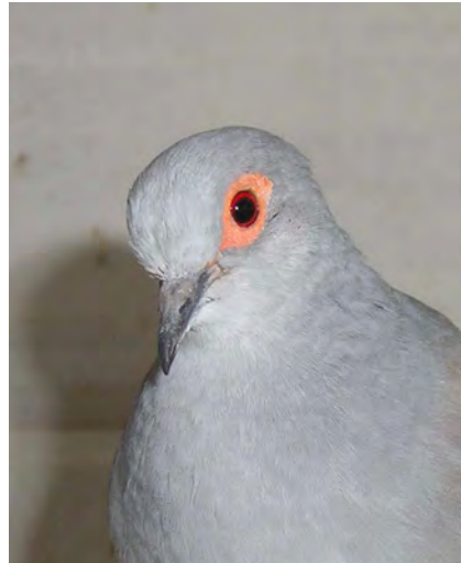
Fig. 2 Kopstudie diamantduif doffer wildkleur

Kortom, diamantduiven zijn mooi, klein, gemakkelijk, levendig, verdraagzaam en vlug vertrouwd met de verzorger.