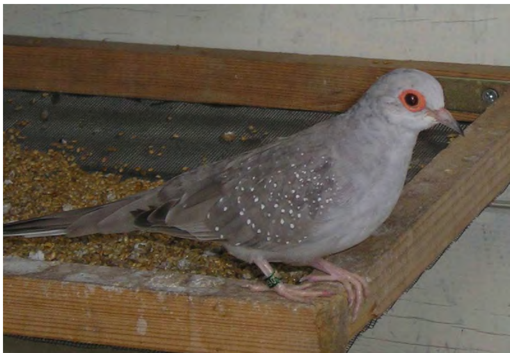
Fig. 6 Diamantduif pastel doffer

Het donker blauwgrijs bij de wildkleur is bij pastel vervangen door zilvergrijs. De snavel is grijs en de nagels zijn lichtgrijs.