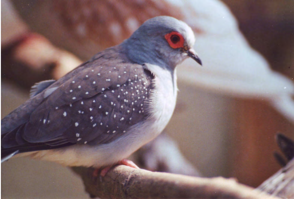
Fig. 1 Diamantduiven zijn echte zoonanbidders (doffer wildkleur)