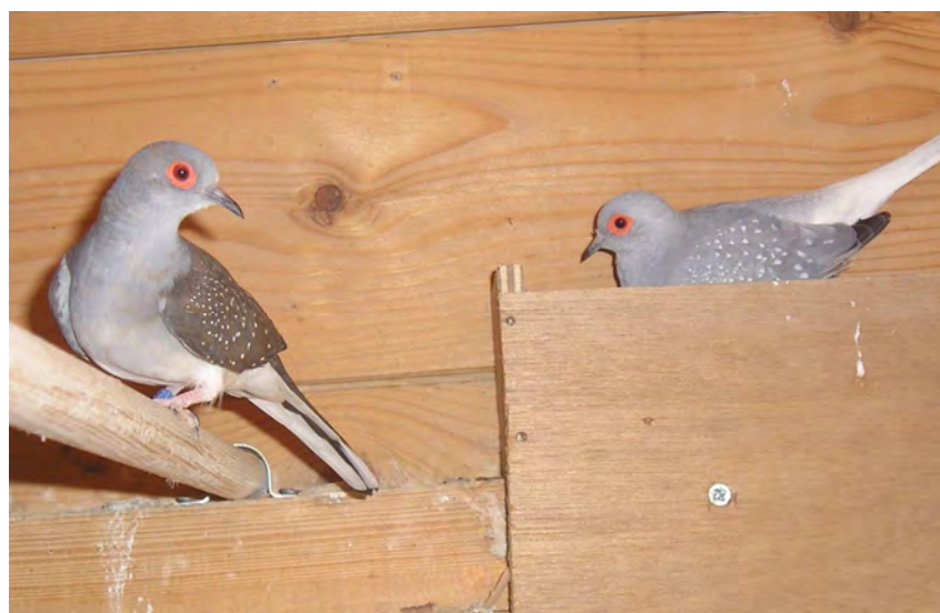
Fig. 10 Een koppel diamantduiven wildkleur witstuit onderzoekt een nestbakje

Wordt een koppel samengesteld, dan balst de doffer voor de duivin. Bij de balts koert de doffer voor de duivin, buigt de kop naar de bodem, blaast zijn borst op en waaiert met de staart. De duivin gedraagt zich heel wat rustiger en zal zo nu en dan ook wat gekoer laten horen. Na verloop van tijd paart de doffer met de duivin.