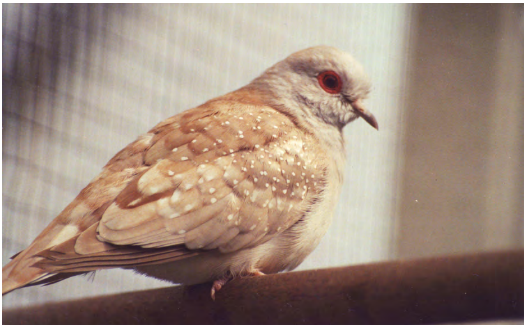
Fig. 5 Diamantduif bruin duivin

Bij bruin-witstuit zijn het onderste deel van de rug en de stuit wit. De kleur van de andere lichaamsonderdelen is dezelfde als bij bruin.