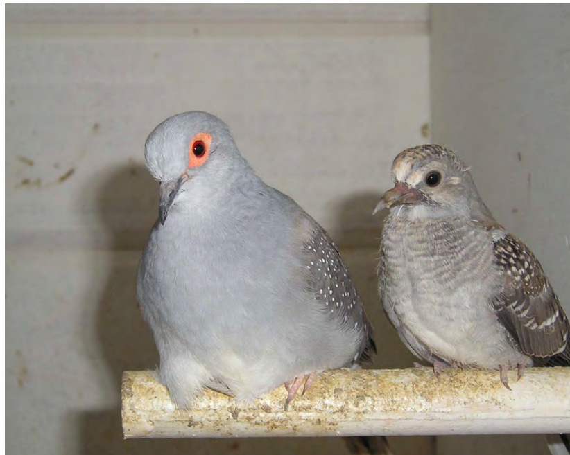
Fig. 16 Wildkleur duivin met een jong van drie weken oud.

Na twee maanden zijn de 'jonge' duiven al niet meer te onderscheiden van de ouders. Op een leeftijd van vier tot vijf maanden zijn de jonge duiven in staat om zelf al weer voor nageslacht te zorgen. De jonge duiven kunnen bij de ouders blijven zolang zij de ouders niet storen bij het volgende nest. Vaak is het beter om de jonge dieren apart te huisvesten.