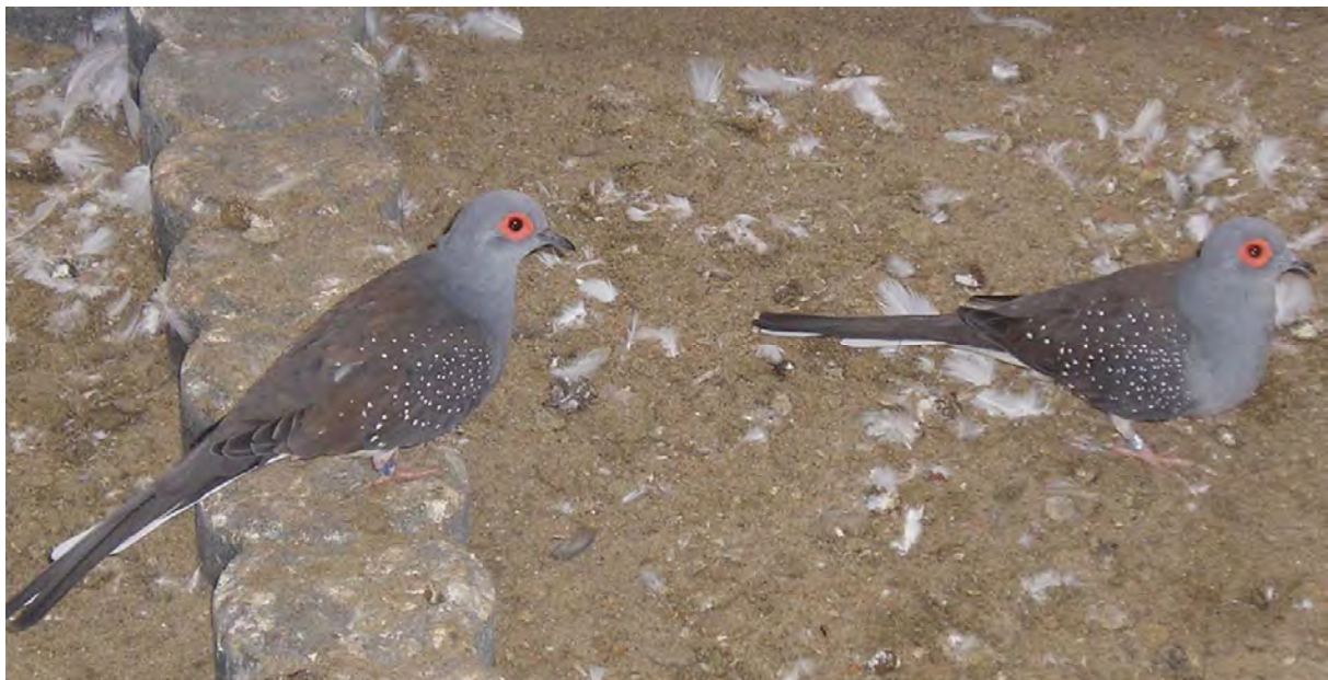
Fig. 9 Een koppel wildkleur diamantduiven scharrelend op de grond

Op de bodem van het hok of de volière kan zo nu en dan een platte schaal met wat water geplaatst worden. Na het baden wordt dit water weer weggehaald, zodat de dieren geen badwater kunnen drinken.