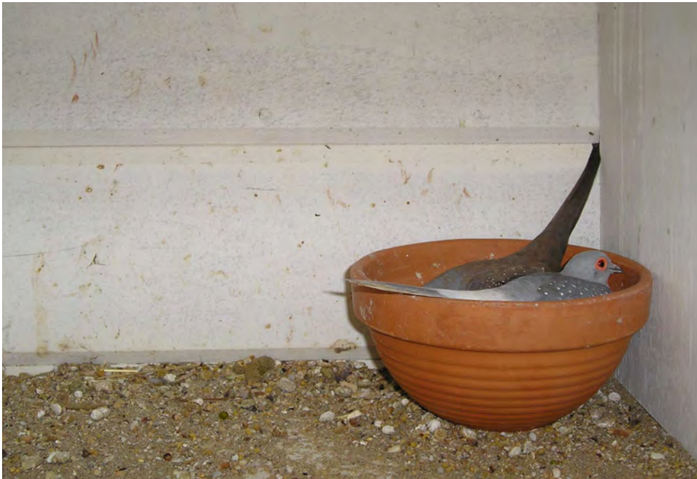
Fig. 15 Met z'n allen lekker in de broedschaal

Na twee maanden zijn de 'jonge' duiven al niet meer te onderscheiden van de ouders. Op een leeftijd van vier tot vijf maanden zijn de jonge duiven in staat om zelf al weer voor nageslacht te zorgen. De jonge duiven kunnen bij de ouders blijven zolang zij de ouders niet storen bij het volgende nest. Vaak is het beter om de jonge dieren apart te huisvesten.