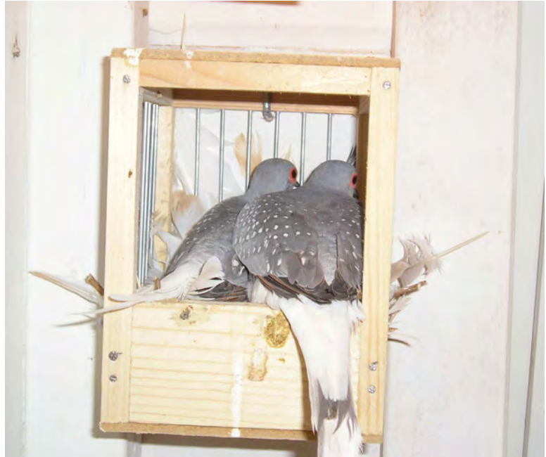
Fig. 11 Dit soort kleine half open nestkastjes worden graag gebruikt. Een wilkleur-witstuit koppel is druk bezig

Daarna legt de duivin kort achter elkaar twee crèmekleurige eieren die door beide ouders worden bebroed. Meestal broed de doffer overdag en de duivin 's nachts. De doffer komt vaak elke dag op dezelfde tijd de duivin aflossen. Meestal komen de eieren rond de 13 de broeddag uit. Een broedsel bestaat vaak uit een doffer en een duivin.