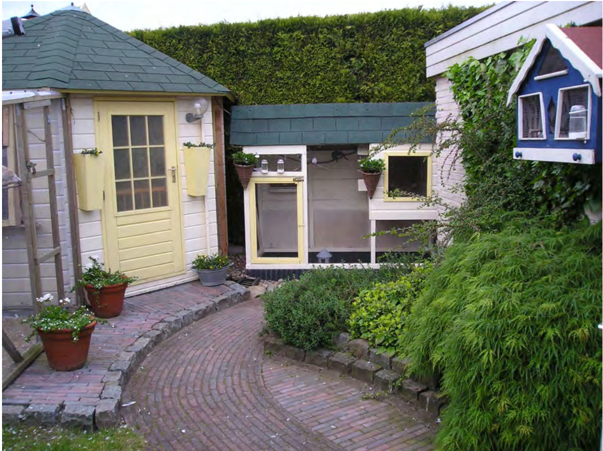
Fig. 7 In het midden een volièrre voor diamantduiven

Diamantduiven worden ook wel permanent binnen gehouden in een binnenvolière of in kleinere kooien. Er zijn dan geen problemen in het koude jaargetijde.