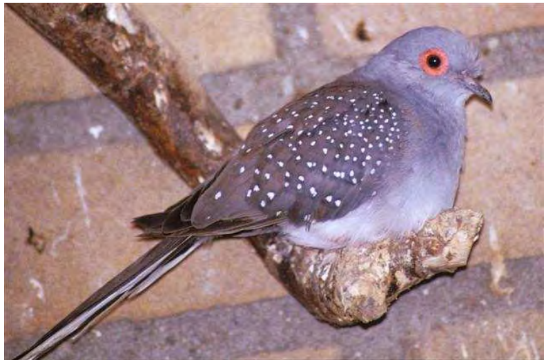
Fig. 3 Diamantduif doffer wildkleur

De vleugels zijn donkergrijs met gebogen regelmatige rijen witte stippen of vlekjes.