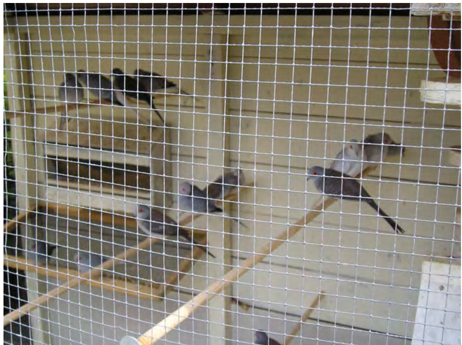
Fig. 8 Een kleinere volièrre met jonge diamantduiven

Diamantduiven zijn vreedzame vogels die zonder problemen samen gehouden kunnen worden met zangvogels of kwartels. Het is zelfs mogelijk meerdere paren bij elkaar te houden, hoewel de volièrre dan wel groot genoeg moet zijn. De mannetjes kunnen tijdens de broedperiode nog wel eens tegen elkaar uitvallen.