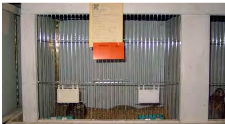
Fig. 22 Tentoonstellingskooi met keurkaart en een rode Verkocht-kaart

Wordt een dier verkocht, dan hangt een medewerker van de tentoonstellingsorganisatie op die kooi een rode Verkocht-kaart.