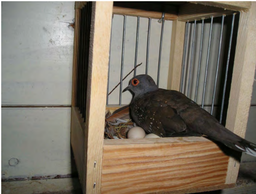
Fig. 12 Een wildkleur duivin met haar twee eieren

Daarna legt de duivin kort achter elkaar twee crèmekleurige eieren die door beide ouders worden bebroed. Meestal broed de doffer overdag en de duivin 's nachts. De doffer komt vaak elke dag op dezelfde tijd de duivin aflossen. Meestal komen de eieren rond de 13 de broeddag uit. Een broedsel bestaat vaak uit een doffer en een duivin.