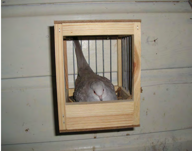
Fig. 13 Een pastel duivin volop aan het broeden

De jonge duiven worden door beide ouders gevoerd met duivenmelk of kropmelk. De productie hiervan komt langzaam op gang als de jongen zijn geboren en neemt daarna ook al snel weer langzaam af. Gaandeweg worden ook zaden aan het menu toegevoegd. Ook wat insectenvoer of wormpjes worden graag bijgevoerd.